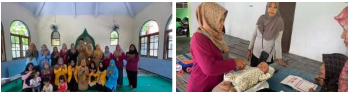
Gambar 2 Kegiatan Pendampingan Posyandu Balita Desa Brenggong

Kemudian, sosialisasi dilanjutkan dengan penyampaian materi oleh Tim KKN mengenai permasalahan stunting dan underweight serta implementasi Gerakan 3P. Materi yang disampaikan menekankan peran kader dalam melakukan pemantauan tumbuh kembang balita melalui pengukuran antropometri dan pencatatan grafik pertumbuhan, pendampingan dengan kunjungan rumah pada balita yang mengalami permasalahan gizi, serta pencerdasan gizi melalui edukasi yang mudah dipahami oleh masyarakat terutama ibu balita. Sebagai bentuk tindak lanjut dan penguatan edukasi, kegiatan sosialisasi tersebut diakhiri dengan pemberian media edukasi berupa mading stunting dan underweight kepada masing-masing kader posyandu di setiap RW/Dusun. Mading tersebut diharapkan dapat dimanfaatkan kader sebagai sarana edukasi berkelanjutan bagi masyarakat dalam upaya pencegahan stunting dan underweight .