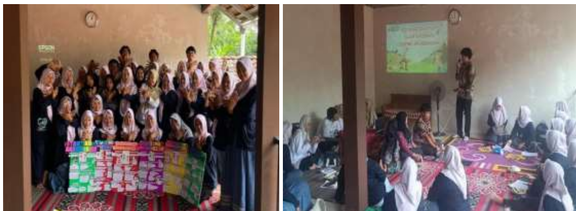
Gambar 3 Kegiatan Sosialisasi Gerakan 3P

Hasil kegiatan pendampingan posyandu dan sosialisasi Gerakan 3P mengindikasikan bahwa permasalahan underweight pada balita di Desa Brenggong masih memerlukan perhatian dan upaya penanganan yang berkelanjutan. Adanya balita yang mengalami underweight menjadi faktor penyebab risiko permasalahan gizi yang berpotensi menjadi stunting apabila tidak ditangani secara optimal. Kegiatan pendampingan posyandu memiliki peran penting dalam deteksi dini permasalahan gizi balita melalui pengukuran antropometri serta pencatatan grafik tumbuh kembang balita. Edukasi gizi kepada ibu balita adalah langkah awal dan strategis dalam upaya perbaikan status gizi anak, karena pengetahuan ibu dan pola asuh mempunyai pengaruh signifikan terhadap pemenuhan gizi balita. Selain itu, pemberian PMT dan edukasi yang dilakukan diharapkan mampu mendorong perubahan perilaku keluarga dalam praktik pemberian makan balita. Sedangkan, kegiatan sosialisasi Gerakan 3P yang melibatkan tenaga kesehatan dan Tim KKN menunjukkan adanya sinergi antara pendekatan tenaga kesehatan dan pemberdayaan masyarakat. Pemberian media edukasi berupa mading kepada masing-masing posyandu tiap RW merupakan strategi pendukung dalam pencegahan stunting dan underweight serta perbaikan gizi secara berkelanjutan.