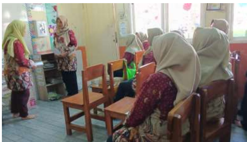
Gambar 2 Simulasi Edukasi Nutrisi dan Pemberian Makan Balita oleh Kader Posyandu

Selain penilaian pengetahuan, dilakukan pula observasi keterampilan kader melalui simulasi ( role play ) edukasi nutrisi dan pemberian makan balita. Berdasarkan hasil penilaian menggunakan lembar observasi keterampilan, sebanyak 17 dari 20 kader (85%) memperoleh kategori keterampilan baik dalam melakukan edukasi nutrisi dan pemberian makan balita. Penilaian meliputi kemampuan menjelaskan prinsip gizi seimbang, menyampaikan jadwal dan porsi makan sesuai usia balita, menggunakan bahasa yang mudah dipahami, serta menunjukkan komunikasi yang efektif dan percaya diri saat edukasi