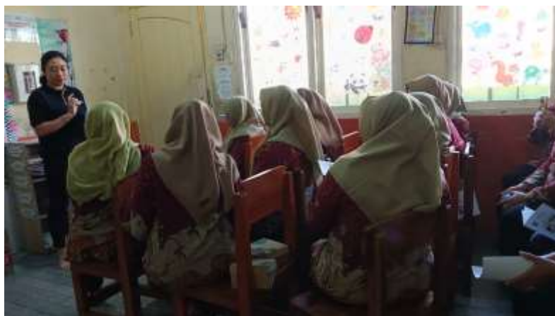
Gambar 1. Kegiatan Pelatihan Kader

pengetahuan cukup menurun dari 35% menjadi 5%, dan kategori pengetahuan kurang menurun dari 5% menjadi 0%.