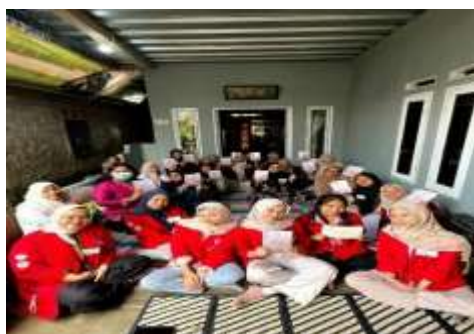
Gambar 3 Pembagian Buku Journaling kepada Peserta

Panitia juga membagikan buku journaling kepada seluruh peserta. Buku tersebut diharapkan dapat menjadi media sederhana bagi ibu rumah tangga untuk menyalurkan perasaan dan mencatat pengalaman sehari-hari, sebagai salah satu upaya menjaga kesehatan mental. Peserta menyambut pembagian buku dengan antusias, beberapa bahkan langsung membuka lembar pertama sambil berdiskusi ringan dengan teman di sebelahnya.