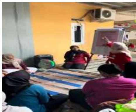
Gambar 2 Demonstrasi Butterfly Hug

Materi yang disampaikan meliputi pengertian kesehatan mental, gejala, jenis, dll serta melakukan demonstrasi butterfly hug untuk menunjukkan teknik reklasasi yang bisa dilakukan pada saat mengalami stress. Selama mengikuti demonstrasi butterfly hug , beberapa peserta terlihat meneteskan air mata, mengeluarkan beban hati yang dirasakan. Selama materi berlangsung, peserta mendengarkan dengan penuh perhatian. Beberapa ibu rumah tangga bahkan terlihat mencatat poin-poin penting untuk dipelajari kembali di rumah.