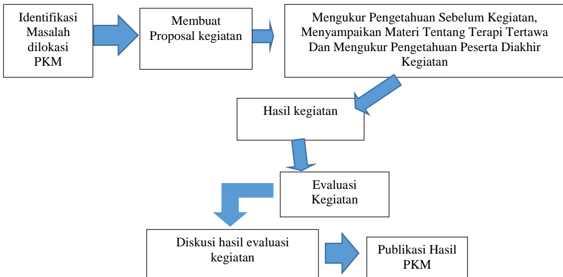
Bagan 1. Alur Pelaksanaan Kegiatan Pengabdian Kepada Masyarakat