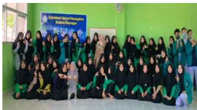
Gambar 4. Kegiatan penyuluhan penyakit Skabies