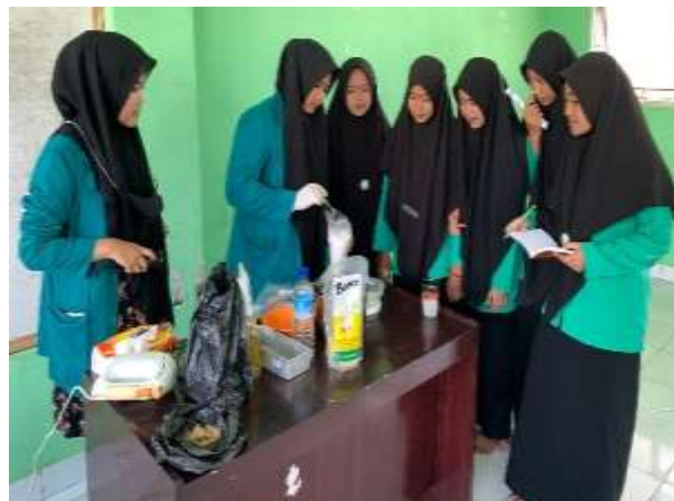
Gambar 3. Kegiatan pembuatan sabun padat organik

Berdasarkan Tabel 2, terlihat bahwa pada nomor 1 jumlah persentasenya 87,5% sehingga dapat disimpulkan bahwa para santri dan santriwati sudah memahami cara/teknik pembuatan sabun padat organik. Pada pertanyaan nomor 2, para santri dan santriwati sudah familiar dengan bahan-bahan pembuatan sabun padat organik karena jumlah persentasenya 100%. Pada pertanyaan nomor 3, para santri dan santriwati sudah sangat yakin untuk membuat sabun padat organik sendiri dari penyuluhan yang sudah diberikan karena jumlah persentasenya 95%. Pada pertanyaan nomor 4, para santri dan santriwati masih terlihat ragu-ragu untuk membuat sabun padat organik sendiri dari jumlah persentasenya 57,5%. Hal ini kemungkinan disebabkan dalam pembuatan sabun dibutuhkan keahlian untuk menangani bahan-bahan yang digunakan karena walaupun sabun ini adalah sabun organik namun bahan kimia yang digunakan tergolong keras dan harus berhati-hati dalam penggunaannya. Pada nomor 5 s.d. nomor 7, para santri dan santriwati merasa sosialisasi dan penyuluhan yang disampaikan sangat menarik dan bermanfaat bagi mereka sehingga membuat mereka sangat paham mengenai skabies dan cara/teknik pembuatan sabun padat organik.