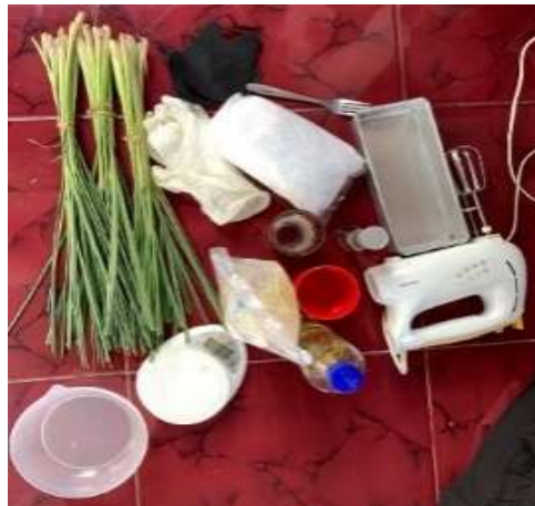
Gambar 1. Alat dan Bahan Pembuatan Sabun Padat Organik

Pelaksanaan kegiatan dilakukan di Pondok Pesantren (Ponpes) Nurul Qur'an Desa Mertak Tombok, Kecamatan Praya, Kabupaten Lombok Tengah, Provinsi Nusa Tenggara Barat. Pelaksanaan kegiatan pengabdian ini dimulai dengan sosialisasi tentang penyakit skabies. Kemudian, dilanjutkan dengan materi penyuluhan tentang pembuatan sabun padat organik. Bahan-bahan yang digunakan adalah minyak kelapa, minyak kelapa sawit, minyak zaitun, air, soda api (NaOH), dan serai yang sudah diparut sebagai aromaterapinya, serta alat-alat yang digunakan adalah tempat cetakan sabun, handscoon , masker, mixer, timbangan dapur digital, gelas kaca, pengaduk (sendok), parut manual, dan wadah tempat pencampuran semua bahan. Target responden dalam kegiatan pengabdian kepada masyarakat ini adalah santri dan santriwati Pondok pesantren (Ponpes) Nurul Qur'an berada di Desa Mertak Tombok, Kecamatan Praya, Kabupaten Lombok Tengah, Provinsi Nusa Tenggara Barat. Tahapan pelaksanaan kegiatan sosialisasi skabies dan praktik membuat sabun padat organik ini melibatkan peserta secara langsung. Setelah itu, para santri dan santriwati akan diberikan kuesioner untuk mengetahui tingkat pemahaman mereka tentang sosialisasi yang sudah diberikan dan pemahaman pembuatan sabun padat organik. Alat dan bahan pembuatan sabun organik dapat dilihat pada Gambar 1.