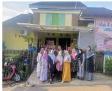
Gambar 2. Peserta dan Tim Pelaksanaan PKM