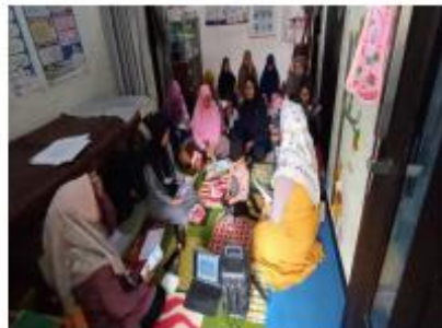
Gambar 1. Pelaksanaan edukasi

Berdasarkan hasil evaluasi akhir juga diperoleh informasi bahwa seluruh ibu hamil yang menjadi peserta pengabdian masyarakat ini sangat antusias dan tertarik untuk melakukan terapi dengan lilin aromaterapi lavender ini, sehingga tindak lanjut berikutnya adalah peningkatan sosialisasi terapi ini kepada masyarakat luas secara umum dan terkhusus pada ibu hamil agar dapat mewujudkan masa kehamilan yang nyaman, aman dan lancar.